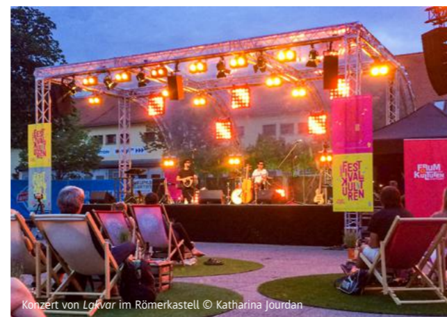
Konzert von Lakvar im Römerkastell

Ein brandneues Sommerfestival-Logo und eine Plakataktion stimmte parallel in der ganzen Stadt bereits auf das Sommerfestival 2021 ein.