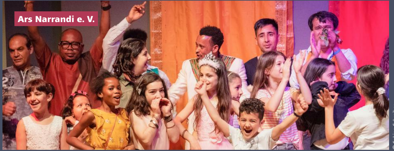
Ars Narrandi e. V.

Die Veranstaltung bietet einen geschützten Raum für den freien künstlerischen Ausdruck zu Themen wie Identität, Rassismus-Erfahrungen und Herausforderungen des Lebens allgemein. Singen, lesen, dichten, tanzen, performen oder nur zuhören – alles ist erlaubt. Das House of Resources förderte das Vorhaben mit 1.100 €.