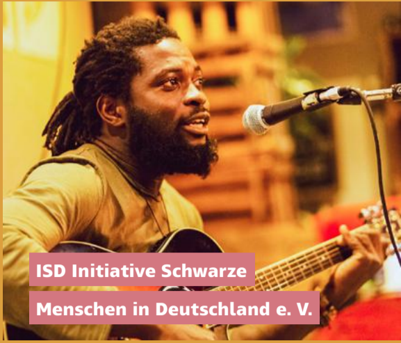
ISD Initiative Schwarze Menschen in Deutschland e. V.