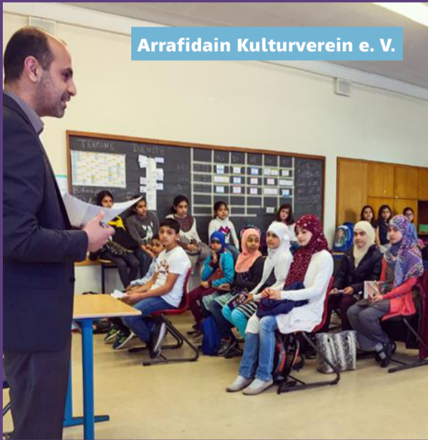
Arrafidain Kulturverein e. V.

Das House of Resources förderte das Vorhaben mit 200 € und brachte weitere Fördermittel durch das Netzwerk samo.fa (Stärkung der Aktiven aus Migrant*innenorganisationen in der Flüchtlingsarbeit) auf den Weg.