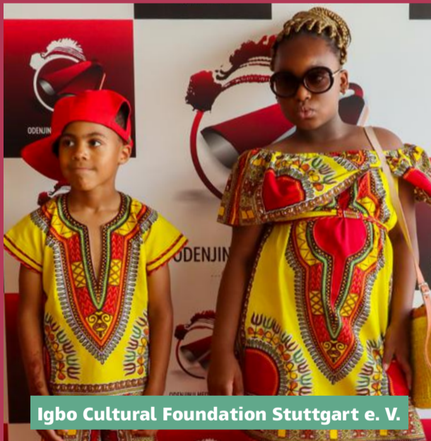
Igbo Cultural Foundation Stuttgart e. V.

Ziel war es, Igbo-Designer*innen aus der Region eine Plattform zu geben, um ihre Mode zu präsentieren. Der Verein will das Konzept in den kommenden Jahren weiter ausbauen, um damit auch internationale Designer*innen nach Stuttgart zu locken und deren kreative Arbeiten hier bekannt zu machen. Das House of Resources förderte die Veranstaltung mit 500 €.