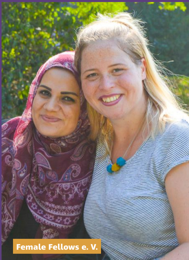
Female Fellows e. V.

Mit der durch das House of Resources mit 2.000 € geförderten neuen Website www.femalefellows.com zur Werbung und Unterstützung der Ehrenamtlichen gelang es, in kurzer Zeit neue Helferinnen zu gewinnen.